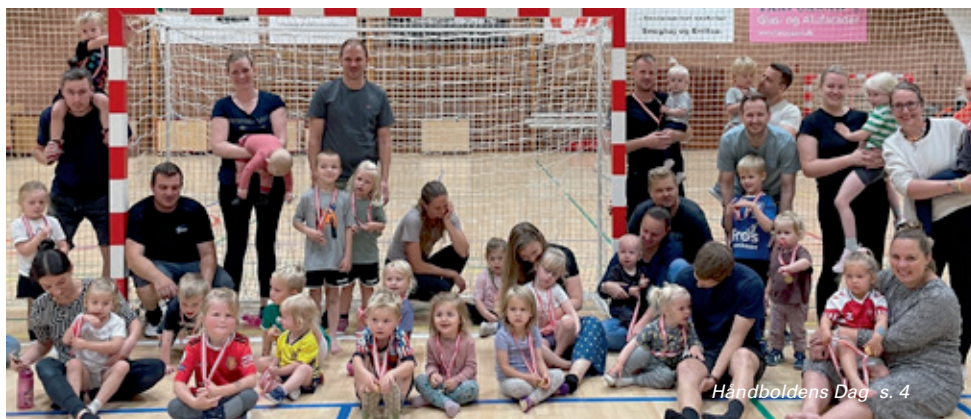
Handboldens Dag - s. 4

Blytækkervej 8, Erritsø, 7000 Fredericia, Tlf. 42 49 24 06